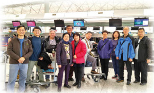
感恩今年有幾位新義工加入服侍，最終一行11人無懼寒春前往當地交流。