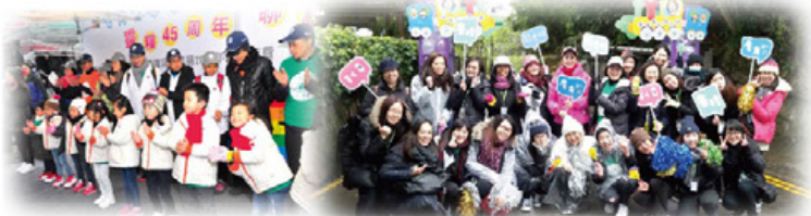
感謝學生全情投入演出及老師用心設計攤位，在嚴寒中散發暖意。