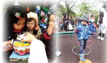
我們盼望透過遊戲，讓孩子更深認識及體會腦癱兒童的處境。