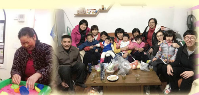
作者(右一)與義工們一同家訪孩子

要。一位小朋友在我接觸她時就張開嘴巴笑了。有時候，小孩只要是感覺獲接納，得到關心，就會笑起來了。我知道我的能力很渺小，也沒有能力根治，始終只有主才可以完全醫治；但我依然很感激主給予我這次經歷，讓我看見這一張張臉孔，也讓我再想起廣西的經歷，想起自己的承諾。