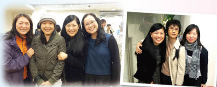
在沉重的需要之中，一眾信徒義工仍然持著盼望同行