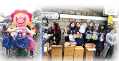
感謝K's Kids繼續大力支持及贊助禮物，使大家滿載而歸！